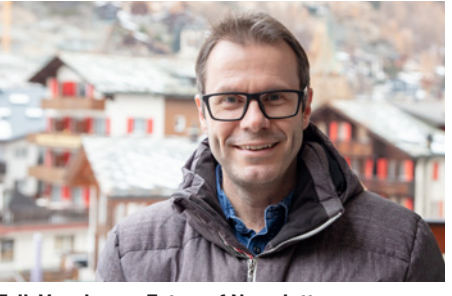
Erik Vogelsang, Fotograf Newsletter