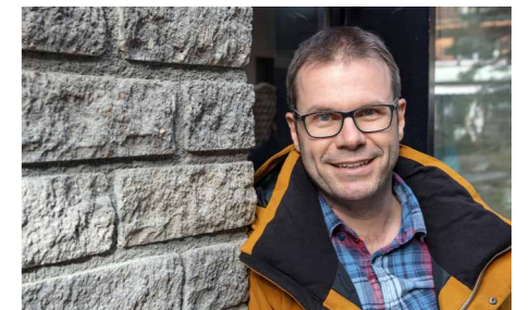
Erik Vogelsang, Fotograf Newsletter